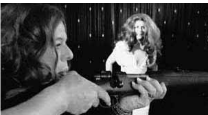
Zeit der Monster