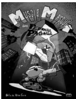
MUSCLE MASQUÉ: DANS FERRAILLE PAGAILLE

"Hopp, Helga! Die Brotgrumbeere" ist die erste Folge eines Serienkonzepts, welches auf der Oma der Regisseurin selbst basiert. Es geht um Alltagssituationen, wie sie jeder kennt, bei denen sich eine Großmutter und ihre Enkelin wegen Banalitäten auf unterhaltsame Art und Weise immer wieder aufs Neue zoffen. Diese kleinen Streitereien sind jedoch nur der Indikator für einen tiefer liegenden Hauptkonflikt, den es in der Familie gibt. Das Video ist eine Hommage an die Oma, die mit ihrer besonderen Eigenart die Hauptinspiration für dieses Projekt ist.