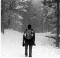
DANS L'OEIL DE LYNX