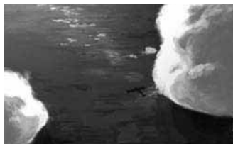
A SHADOW IN THE CLOUDS